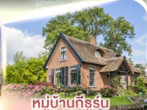
หมู่บ้านทีร์น