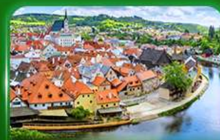
เมืองมรดกโลก เซสกีครุมลอฟ