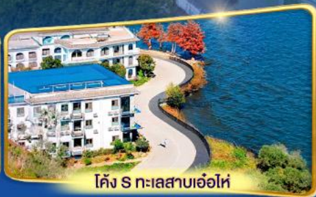
โค้ง S ทะเลสาบเอ๋อไห่