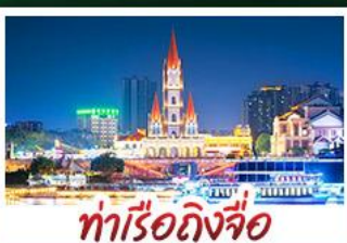
ท่าเรือกิ่งจื่อ

เขาชิงชู้สวนดอกไม้ตามฤดูกาล หมู่บ้านสไตล์ยุโรปเที่ยงยวี่ มังซิง เสี่ยวเจิ้น ถนนคนเดิน NANNING ZHIYE - เมืองโบราณไท่ผิง ท่าเรือกิ่งจื่อ - ถนนคนเดิน สามตรอกสองซอย