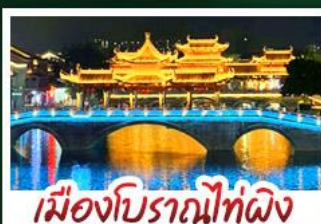
เมืองโบราณไท่ผิง