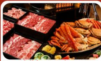
บุฟเฟ่ต์ซาบู ซาปู 3 ชนิด