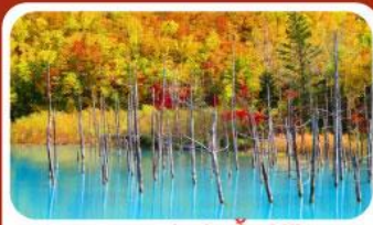
บลูพอนด์ (บ่อน้ำสีฟ้า)