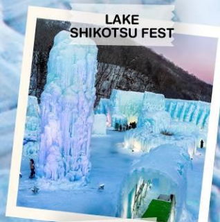
LAKE SHIKOTSU FEST