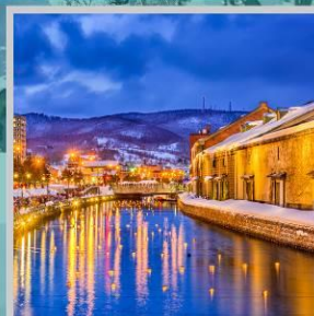
“OTARU CANAL FEST”