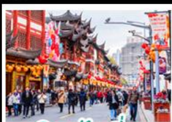
เฉิงหวิงเมี่ยว