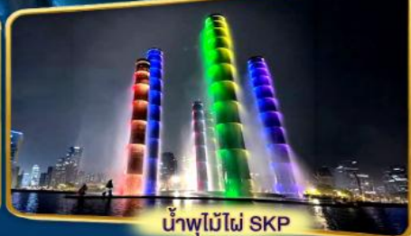
น้ำพุไม้ไผ่ SKP