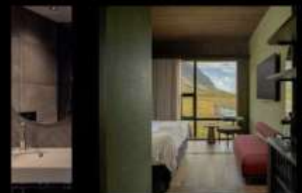
HÓTEL JÖKULSARLON - GLACIER LAGOON HOTEL