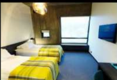
FOSSHOTEL GLACIER LAGOON

(โรงแรมในเขต South Shore มีน้อยและค่อนข้างจำกัด ไม่เพียงพอต่อปริมาณนักท่องเที่ยว ทางบริษัทฯจะเลือกสรรโรงแรมที่ดีและเหมาะสม) ค่าคืนนี้ท่านสามารถล่าแสงเหนือได้จากที่พักโรงแรม NORTHERN LIGHT (AURORA BOREALIS) เป็นปรากฏการณ์ที่เกิดขึ้นตามธรรมชาติในเขตบริเวณขั้วโลกเหนือในกลุ่มประเทศที่อยู่เหนือเส้นอาร์กติก เซอร์เคิล โดยมีประเทศไอซ์แลนด์รวมอยู่ด้วย มักจะพบเห็นได้ทั่วไปเนื่องจากเป็นแสงที่มาจากชั้นบรรยากาศเหนือพื้นโลกไปราว 100-300 ก.ม. โดยจะเห็นได้ชัดเจนในช่วงเวลาฟ้าเปิด และอยู่ในระหว่าง เดือนกันยายน-เดือนเมษายน ของทุกปี