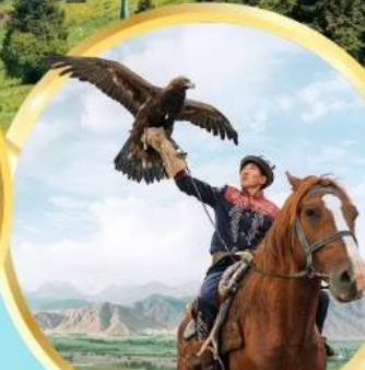
ชมโซว์นกอินทรี