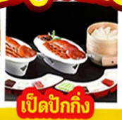
เปิดปีกัง