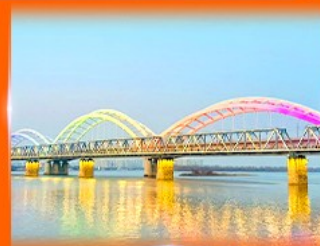
สะพานรถไฟผืนโจว