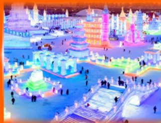
เที่ยว ICE & SNOW WORLD