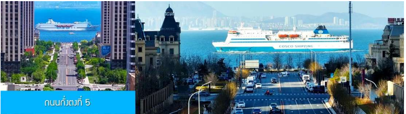
ถนนกั๋วตงที่ 5

หลังอาหารนำท่านเที่ยวชม ถนนกั๋วตงที่ 5 港东五街 จุดเช็คอินใหม่ที่ได้ได้รับความนิยมอย่างสูงจากนักท่องเที่ยวและชาวเมืองต้าเหลียน จุดนี้เป็นช่วงที่ถนนสายกั๋วตงที่ห้า มุ่งตรงสู่ทะเล(มองจากจุดชมวิวที่อยู่ด้านบน) เสมือนว่าปลายทางของถนนไปสิ้นสุดในทะเล อีกด้านจะมองเห็นท่าเรือและอาคารสถาปัตยกรรมตะวันตกเป็นกรอบของมุมมองที่งดงาม เมื่อมีเรือแล่นมาผ่านทะเลตรงบริเวณนี้ จะเป็นภาพที่สวยงามและโรแมนติก