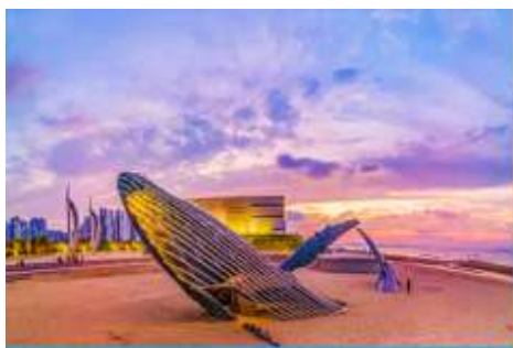
ประติมากรรม วาฬโด้ดเดี่ยว

05.30 น. เรือท่องเที่ยวขนาดคณะเดินทางถึงท่าเรือเมืองเยียนไถ นำท่านขึ้นรถบัสเพื่อเดินทางสู่ตัวเมืองเยียนไถ เช้า รับประทานอาหารเช้า ณ ห้องอาหารของโรงแรม (7) หลังอาหารนำท่านเที่ยวชม ท่าเรือชาวประมงไห่ซาง 烟台海昌鱼人码头 ท่าเรือนี้เต็มไปด้วยสถาปัตยกรรมสไตล์อเมริกันเหนือ และยุโรป ให้ท่านได้สัมผัสและเก็บภาพบรรยากาศที่แสนโรแมนติกริมทะเล ที่มีอาคาร