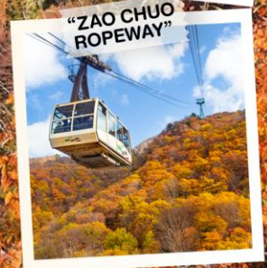
"ZAO CHUO ROPEWAY"

วันเดินทาง 30 ต.ค. - 5 พ.ย. 2569 4 - 10 พ.ย. 2569