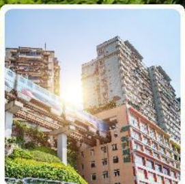
รถไฟฟ้าทะลุถ้ำ