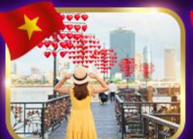
เซ็คอินสะพานแห่งความรัก