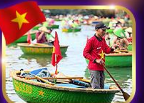
เรือกระด้ง หมู่บ้านกิมทาน