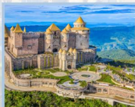
ปราสาทจันทร