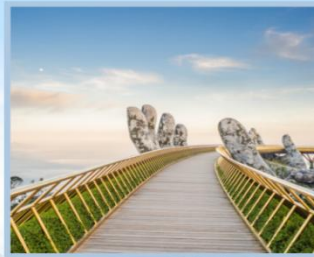
สะพานมือทองคำ