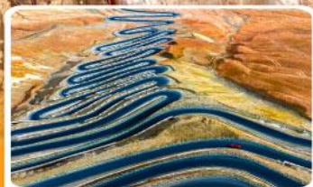
ถนนผานหลงกู่ต้าอว