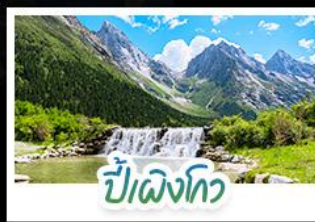
ปี้เผิงโกว