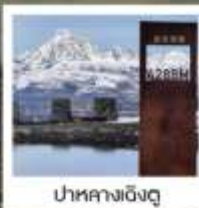
ป่ากลางเซิงตู