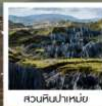
สวนหินป่าเหมย