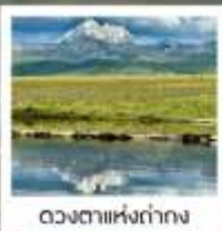
ดวงตาแห่งต่ำทง