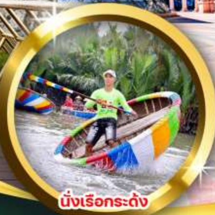
นั่งเรือกระดิ่ง