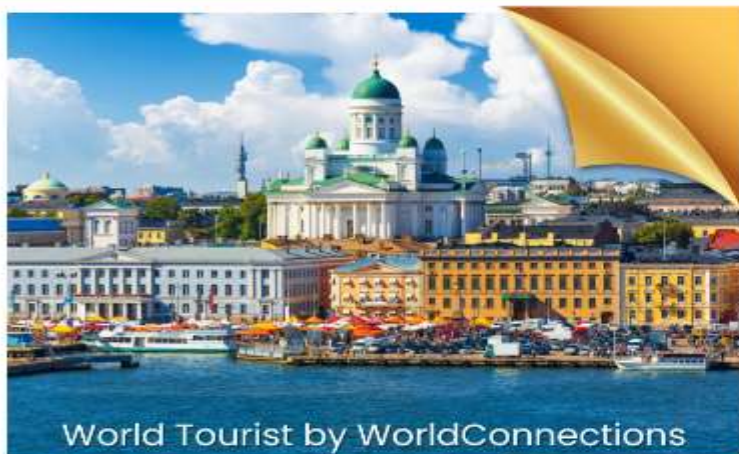
World Tourist by WorldConnections