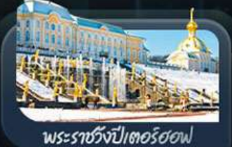
พระราชวังปีเตอร์ฮอฟ