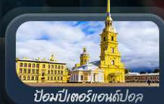
ป้อมปืนอาร์ทillery

highlight สองเมืองไฮไลท์ของรัสเซียที่ไม่ควรพลาด! ตื่นตาตื่นใจกับมหาวิหารเซนต์บาซิล ชมความยิ่งใหญ่ของจัตุรัสแดง สัมผัสอดีตที่พระราชวังเครมลิน ชมความงามของสถานีรถไฟใต้ดินมอสโก ชาร์กอร์ส โบสถ์ไอสิกรีนดี เป็นมหาวิหารโรมาเนสก์ได้สัมผัส ชมความงามพระราชวังฤดูหนาว พิพิธภัณฑ์ออร์มิกง ป้อมปีเตอร์แอนด์ปอล และมหาวิหารเซนต์ไอแซค