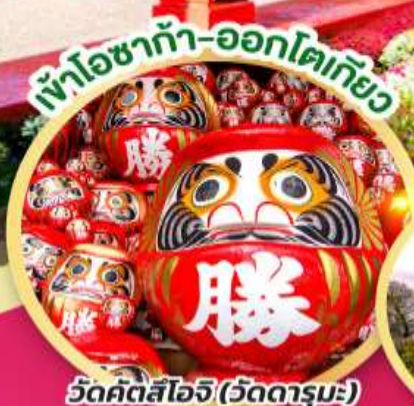
เข้าโซาก้า-ออกโตเกียว