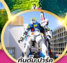
กันดั้มปาร์ค ฟุกุโอกะ