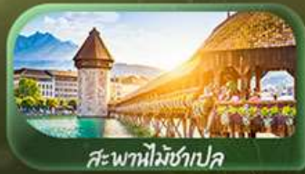
สะพานไมซ์าเปิล

📅 เดินทาง 02-10 เม.ย. 69 / 24 เม.ย.-02 พ.ค.69 29 เม.ย.-07 พ.ค.69 / 29 พ.ค.-06 มิ.ย.69