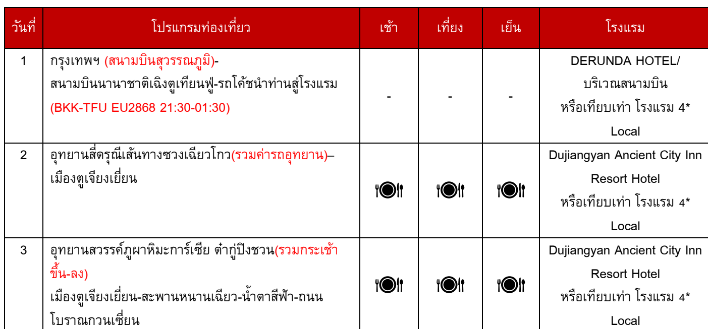
SPHZ-CD7 CHENGDU 2 UTAYAN- 5D4Nเดินทางด้วยสายการบิน Chengdu Airlines (EU)