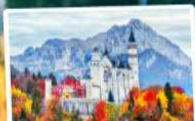
ปราสาทน้อยชวานส์ไตน์

09-15, 15-21 ต.ค. 68 23-29 ม.ค. / 25 ก.พ.-03 มี.ค. 69 06-12, 18-24 มี.ค. 69 01-07, 09-15, 10-16, 12-18 เม.ย. 69 29 เม.ย.-05 พ.ค. / 30 เม.ย.-06 พ.ค. 69 28 พ.ค.-03 มิ.ย. 69